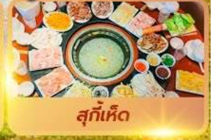
สุกี้เห็ด