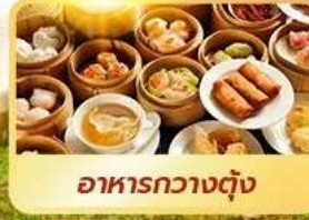
อาหารกวางตุ้ง