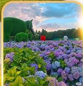
ดอกไม้ตามฤดูกาล