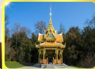
ศาลาไทยไชยาน์

02 - 09, 16-23 ก.ย.69 / 07 -14, 22-29 ต.ค.69 เดินทาง : 04 - 11, 11-18 พ.ย.69 / 25 พ.ย. - 02 ธ.ค.69 03 - 10, 23-30 ธ.ค.69 29 ธ.ค.69 - 05 ม.ค.70