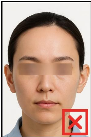
รูปที่ไม่ได้ขนาด ตามที่สถานทูตกำหนด