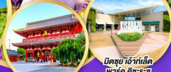
มิตซูเอะอิเกะ พาร์ค คิชะระชู