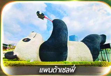
แพนด้าเซฟี่