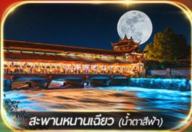
สะพานหนานเจียว (น้ำตาสีฟ้า)