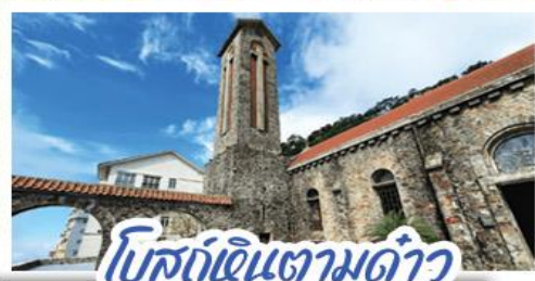
โบสถ์หินตามด้าว