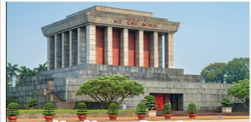
จัตุรัสบาติงห์