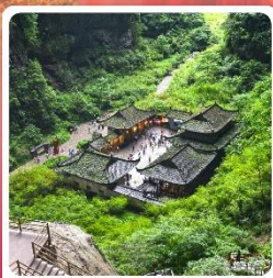
หลุมบ่อฟ้า