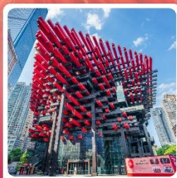
ตึกตะเกียบ