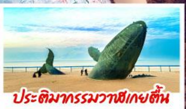
ประติมากรรมวาฬเกยตื้น