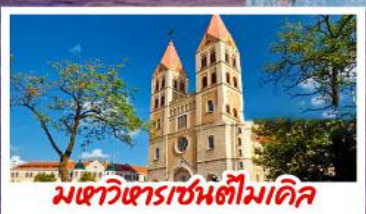
มหาวิหารเซนต์ไมเคิล