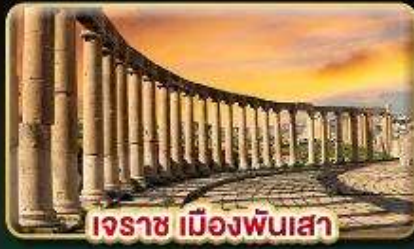
เอราซ เมืองพันเสา