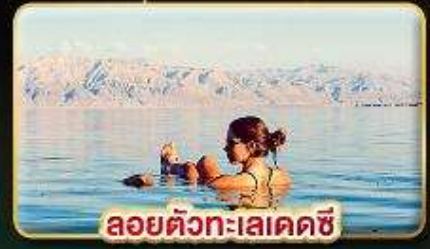
ลอยตัวทะเลเดคซี