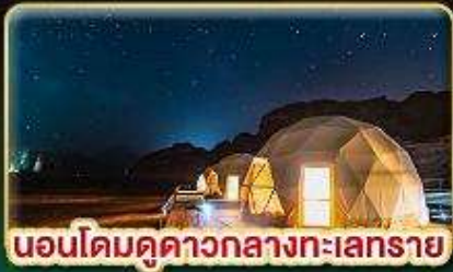
นอนโดมดูดาวกลางทะเลทราย

📅 เดินทาง: 17-24 ต.ค. | 06-12 ส.ค. 69 26 ส.ค. 69 - 02 ม.ค. 70