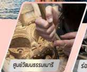
ศูนย์วัฒนธรรมเมารี