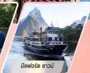
มิลฟอร์ด ซาวน์