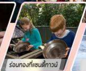
ร้อนทองที่แซนดี้ทาวน์