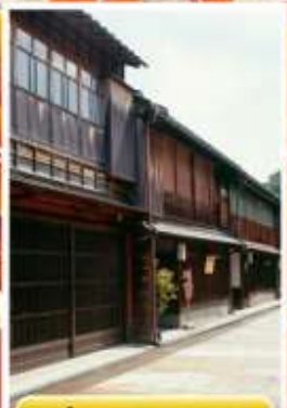
ย่านอิงาชิซายะ