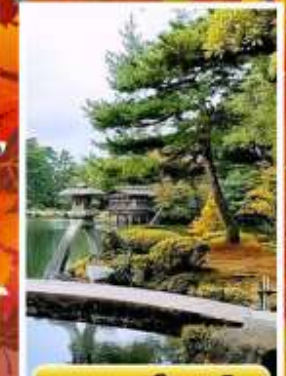
สวนเคนโระคุเอิน

ออนเซ็น 3 คั้น นน.กระเป๋า 23 กก. 7Days 5Night