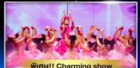
พิเศษ!! Charming show