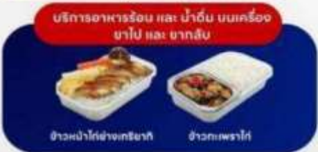
บริการอาหารร้อน และ น้ำดื่ม บนเครื่อง ขาไป และ ขากลับ