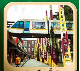
“ตงเจียวจี้”