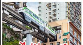
รถไฟทะเลลู่ตีก