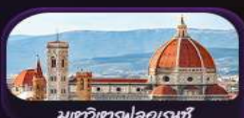
มหาวิหารฟลอเรนซ์