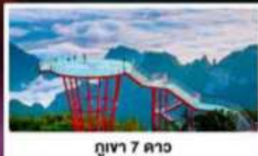
กุเวา 7 ดาว