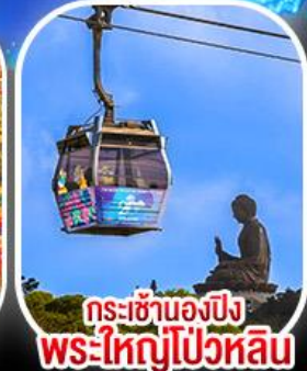
กระเช้าเองปีงพระใหญ่โป่วหลิน