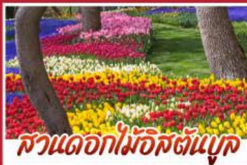
สวนดอกไม้ฮิสตันบูค