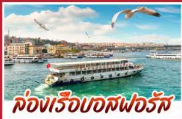
ล่องเรือบอสฟอรัส