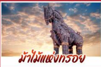
ม้าไม้แห่งทรอย