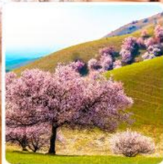
ทุ่งดอกอัลมอนต์