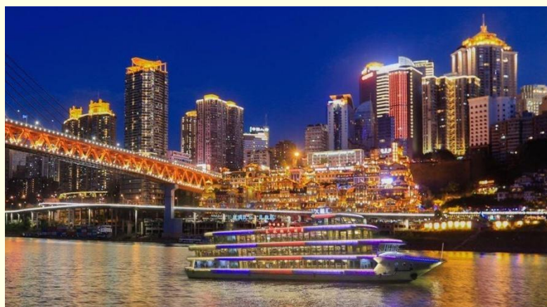
Option เสริม ล่องเรือราตรีชมแม่น้ำสองสาย

*ราคาทัวร์นี้ยังไม่รวมค่าบริการค่าล่องเรือ สำหรับท่านที่สนใจจะมีค่าบริการท่านละ 300 หยวน (ราคาอาจมีการเปลี่ยนแปลง กรุณาตรวจสอบราคาก่อนซื้ออีกครั้ง)*