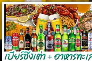
เบียร์ชิงเต่า + อาหารทะเล