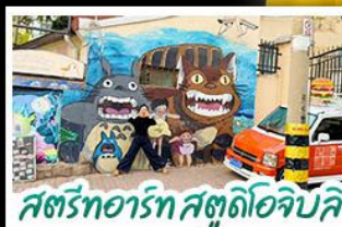
สตรีทอาร์ต สตูดิโอจิบลิ