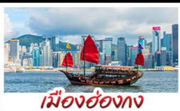
เมืองฮ่องกง

เมืองเก่าซิงเต่า - วิวเมืองฮ่องกง โรงเบียร์ซิงเต่า - ทำเรือชาวประมงเยียนโก