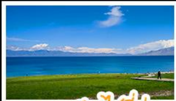
ทะเลสาบไซลีมู

หุบเขาดอกท้อ - ทะเลสาบไซลีมู แกรนด์แคนยอนตู่ชานจื่อ - ทุ่งหญ้าหาลาถี้