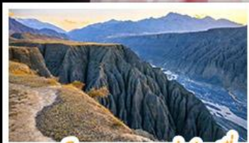
แกรนด์แคนยอนตู่ชานจื่อ