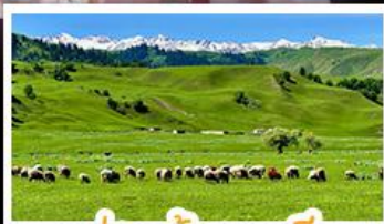
ทุ่งหญ้าหาลาถี้