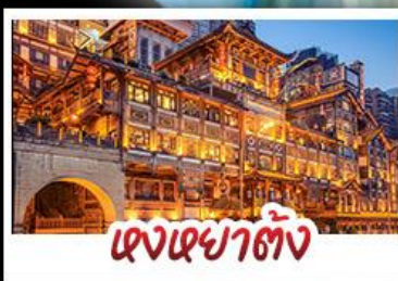
ตงเซาตัง