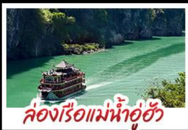
ล่องเรือแม่น้ำอู่ฮัว

ดงซิ่ง - อุ๋หลง - เวียดนามเจียง หลุมฟ้าสามสะพานสวรรค์ - หงหยาดัง พุทธศิลป์ต้าจู๋ - ล่องเรือแม่น้ำอู่ฮัว