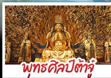
พุทธศิลป์ต้าจู๋