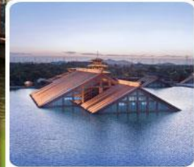
พิพิธภัณฑ์ไดโนเสาร์กวางตุ้ง