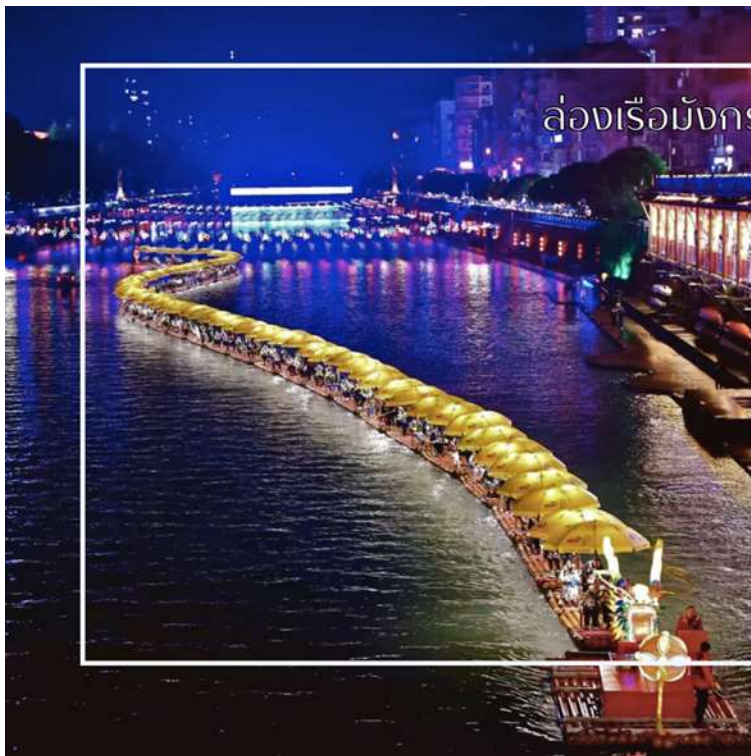
ล่องเรือมังกรแม่น้ำก้งสู่ย

นำท่านสัมผัสประสบการณ์สุดพิเศษ ล่องเรือมังกรแม่น้ำก้งสู่ย ชมวิวยามค่ำคืน เป็นหนึ่งในแม่น้ำที่มีความงดงามและสำคัญ มีชื่อเสียงจากทิวทัศน์ธรรมชาติที่อุดมสมบูรณ์ ริมฝั่งเต็มไปด้วยป่าไผ่ ป่าเขา และภูเขาหินทรายสลับซับซ้อน สายน้ำใสไหลเย็นตัดผ่านหุบเขา สร้างทิวทัศน์ที่งดงามดุจภาพวาด