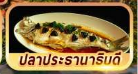
ปลาประรานาโรบิต