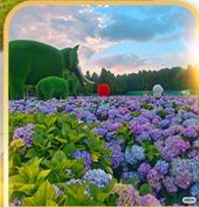
ดอกไม้ตามฤดูกาล