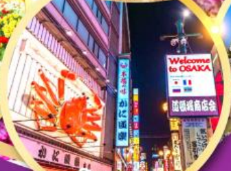
ช้อปปิ้งชินไซ บาชิ