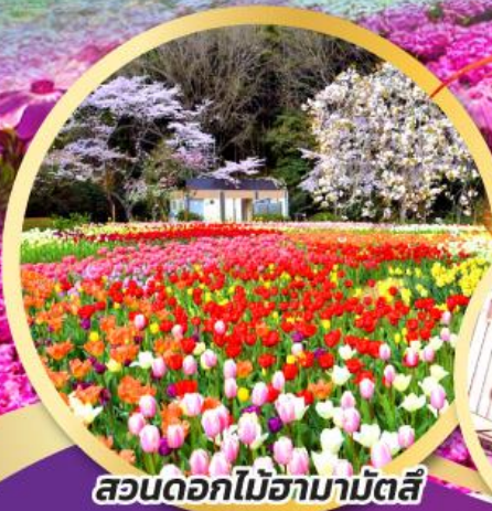
สวนดอกไม้ฮามามัตสึ