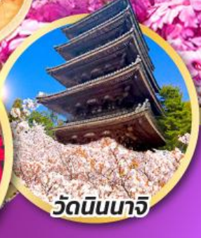
วัดนินนาจิ