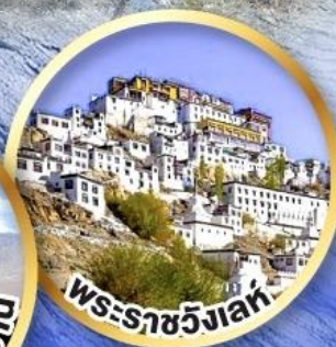
พระราชวังเลห์