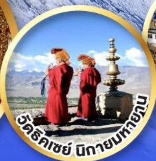
วัดธิกะชัย นิกายมหายาน