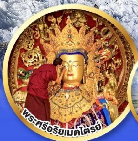
พระศรีอริยเมตไตรย์