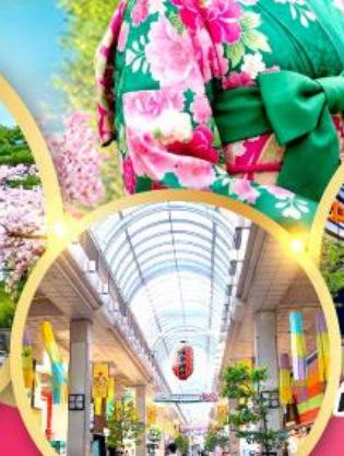
ช้อปปิ้ง ถนนอิชิบังโจ