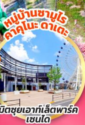
มิตรชุยเอาก์เล็ตพาร์ค เซนได