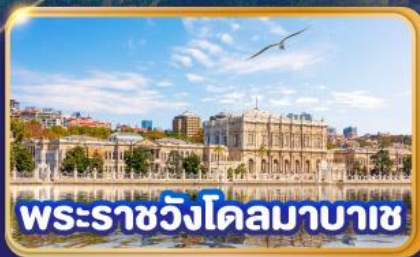
พระราชวังโดลมาบาซ