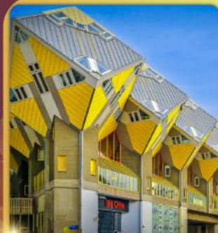
บ้านลูกเต๋า โคกคูนุส

“ล่องเรือหลังคากระจก” ชมกรุงอัมสเตอร์ดัม