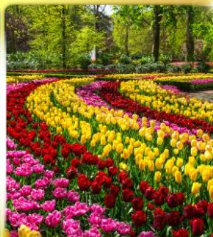
เทศกาลดอกไม้เคอเคนฮอฟ

เดินทาง 8 วัน 5 คืน 05-12, 07-14 เม.ย. 69 27 เม.ย. – 04 พ.ค. 69 06-13 พ.ค. 69 27 พ.ค. – 03 มิ.ย. 69 17-24 มิ.ย. 69