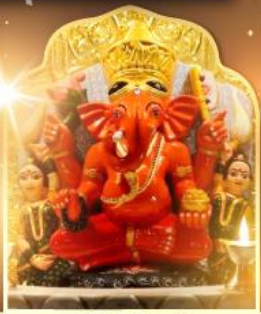
องค์สิทธินายิก