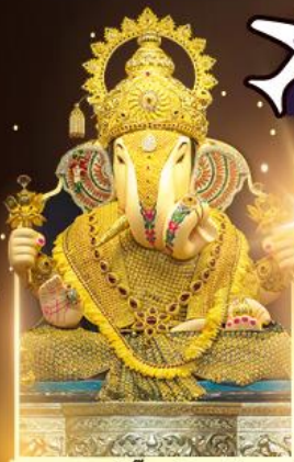
องค์ตั้งบูชท์พิเศษ