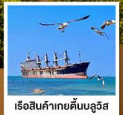
เรือสินค้าเกย์ตันบลูวิส