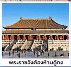
พระราชวังต้องห้ามปักกิ่ง