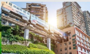
รถไฟฟ้าทะเลสาบ