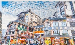
หมู่บ้านโบราณฉือซีโซ่ว

*ทางบริษัทฯ ขอสงวนสิทธิ์ในการสลับโปรแกรมทัวร์ตามความเหมาะสมขึ้นอยู่กับสถานการณ์ทำงาน โดยคำนึงถึงผลประโยชน์ของลูกค้าเป็นสำคัญ