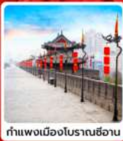
กำแพงเมืองโบราณซีอาน