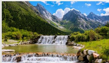
อุทยานแห่งชาติปี้เฟิงโกว