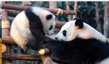
หุบเขาแพนด้าตูเจียงเอี้ยน