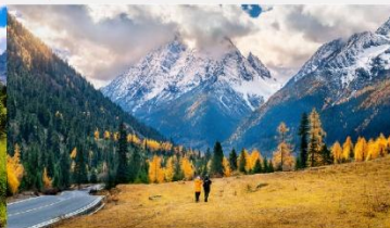
ภูเขาสี่ดรุณี (หุบเขาชวงเจียวโกว)