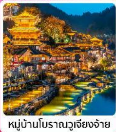
หมู่บ้านโบราณวูเจียงจ้าย