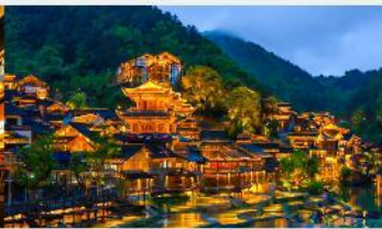
หมู่บ้านโบราณวูเจียงจ้าย