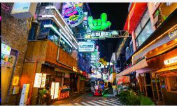
ถนนคนเดินซิงหยุน