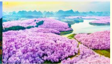
ชากรุง-ผิงป่า

*ทางบริษัทฯ ขอสงวนสิทธิ์ในการสลับโปรแกรมทัวร์ตามความเหมาะสมขึ้นอยู่กับสถานการณ์หน้างาน โดยคำนึงถึงผลประโยชน์ของลูกค้าเป็นสำคัญ