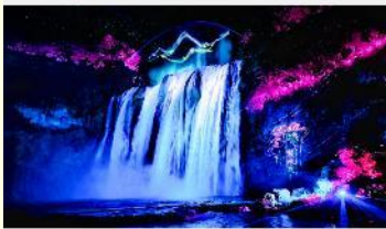
อุทยานน้ำตกหวงกั๋วซู่