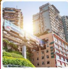
รถไฟฟหะลูตึก