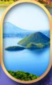
วิวทะเลสาบโทโยะ