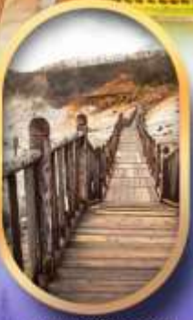
หุบเขาจิกุกดาบิ