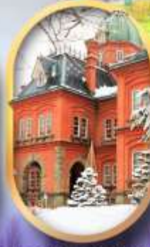
ศาลาว่าการฮอกไกโด