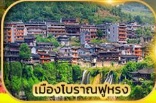
เมืองโบราณฟูหลง