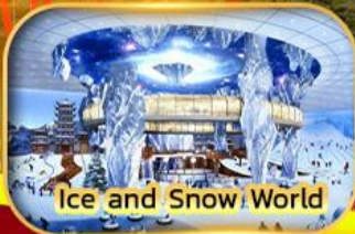
Ice and Snow World