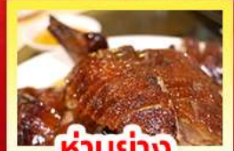
ห่านย่าง