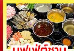
บุฟเฟ่ต์ซาบู