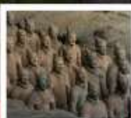
พิพิธภัณฑก์องทัพใต้ดิน