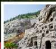
ท่าหลงเหมิน

ตลาดกลางกิบไคเฟิง / ศาลไคเฟิง / ประตูเมืองท่าต้าเหลียงเหมิน / สวนชิงหิงซึ่งเหอ อุทยานหยุนโกซาน / วัดเล่าหลิน / ป่าเจดีย์ / โซ่ววิทย์ยาตูกุเอ่ล้าหลิน / โซ่ว SHAOLIN MUSIC CEREMONY ท่าหลงเหมิน / ชมดอกโบตั๋น / ถนนคนเดินสี่จั๊งเหมิน / เมืองโบราณคิ้วอี่ (ฟรีใส่ชุดพื้นเมืองชาวฮั่น) กำแพงเมืองอี่เกียหนเหมิน / พิพิธภัณฑก์องทัพใต้ดินทหารม้าจีนซี / โซ่วราชวงก์ถัง / กำแพงเมืองโบราณซื่ออัน จัตุรัสหอรบะมิง + หอกลอง / ตลาดมุสลิม / JOY CITY / เจดีย์ห่านป่าใหญ่ / ถนนคนเดินวัฒนธรรมต้าถัง