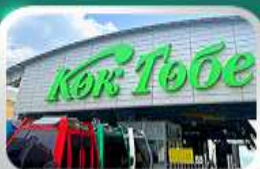
ซิ่นโทกโทเบชมวิวอักแทร์

นั่งกระเช้าชิมบุลัค-ทะเลสาบโคลไซ-โบสถ์เซนต์คาทอลิก