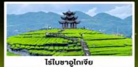
ไร่ชาอู๋โตเจีย