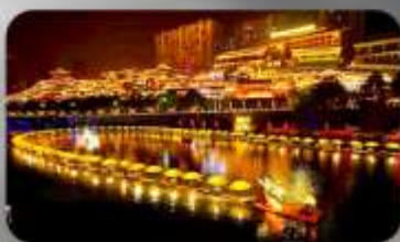
เมืองโบราณเซียนเอน