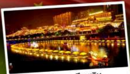
เมืองโบราณเซียนเิน

เที่ยว 2 เมือง จางเจียเจีย & เอนซือ ล่องเรือแคนยอนผิงซาน เที่ยวหุบเขาอวตาร