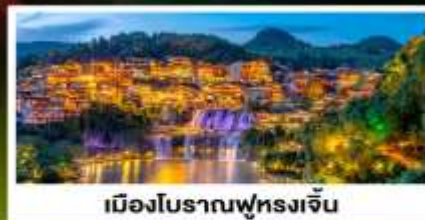
เมืองโบราณฟู่ทงเจิ้น