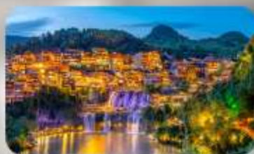
เมืองโบราณฟุทงเจิน