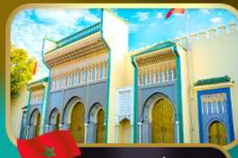
ประตูพระราชวังหลวง