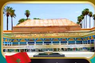
พระราชวังบาเอีย