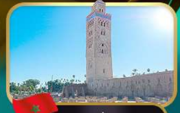
มัสยิดคูตูเบีย มาราเกช

หมู่บ้านเซฟซาอูน • หอคอยอัลซัน • ป้อมอูดายาส • สุเหร่าไครเวิน • สุสานมูเลย์ อีสมายิล • จัตุรัสมาอาลฟา • อัฒนาฮัดดู • ป้อมทาจูริก • ย่านฮูบิส • จัตุรัสโมอัมเหม็ดที่ 5