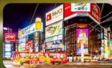
ซูปป์ิงย่านซูซุกิโนะ