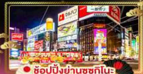
• ช้อปปิ้งย่านซุกุทินะ