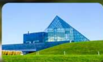
Glass Pyramid HIDAMARI